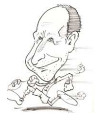
MONTAJE: José María Martín Sánchez